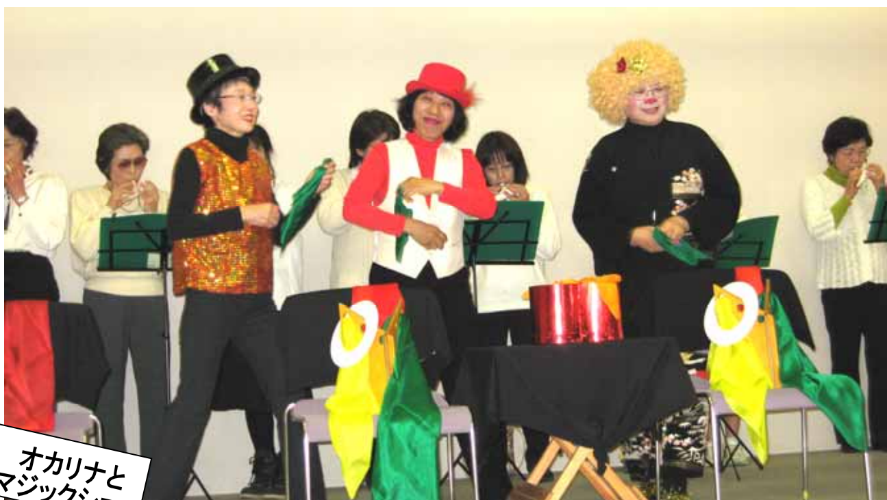
オカリナと マジックショー

交流会では、食事をとりながら踊りやクイズ・防災寸劇・オカリナとマジックショーなど市民活動団体の協働発表が行われた後、自己紹介などで交流を図りました。フィナーレは「ズンドコ節」の軽体操で盛り上がり、新しい出会いや発見がありました。