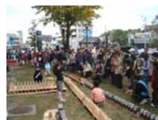
ドミノ倒しの様子 (11/15 瀬戸蔵にて)

6月に始めたドミノ製作から、当日の運営まで児童と地域のおじさんたちと協働で行ったプロジェクト。ご覧になった市民の皆さんにも、一緒に楽しく市制 80 周年をお祝いしていただけたと思います。市民活動センターの HP に各プロジェクトの活動報告を掲載しています。ご覧ください。