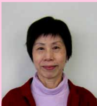
瀬戸メサイア合唱団